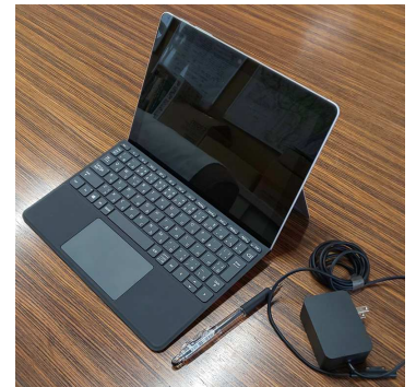
児童生徒用タブレットパソコン