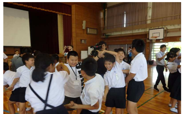
人間知恵の輪 皆で楽しく交流