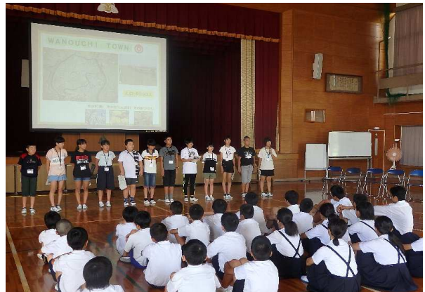
郡山小学校6年生の皆さんに輪之内町を紹介