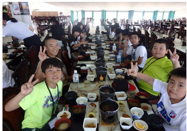
桜島物産館での食事