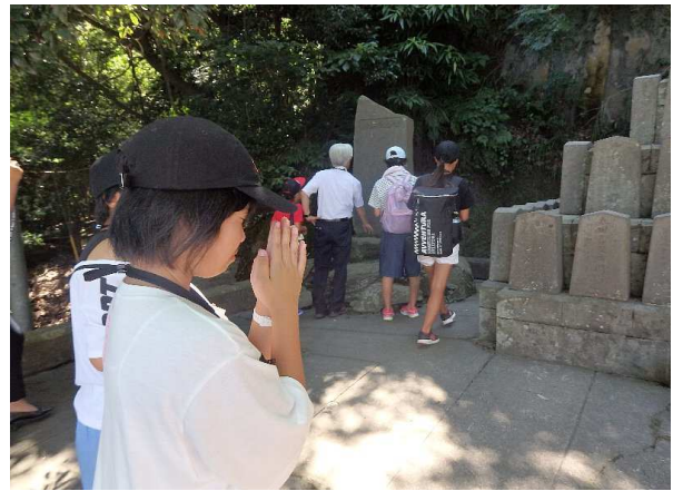
薩摩義士に対して感謝の気持ちを