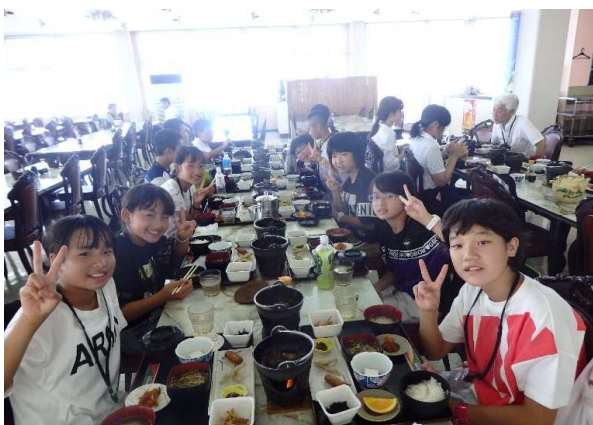
桜島物産館での食事