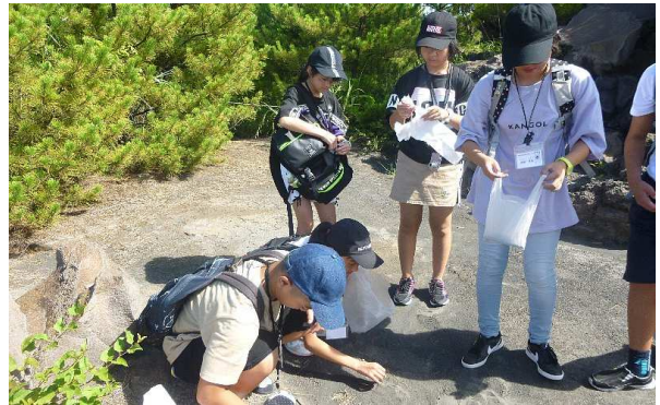
桜島の火山灰を採取