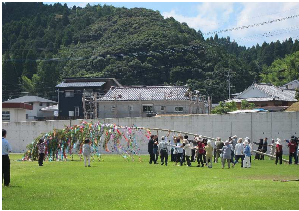
願い事を付けた七夕飾りの完成