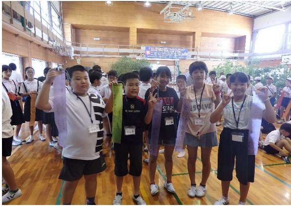
たんざくを大きな竹に飾り付け