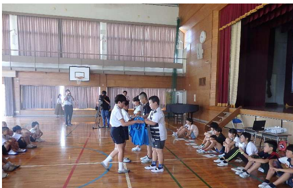
輪之内町からのプレゼント