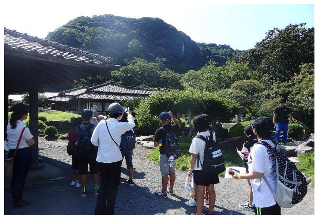
仙巖園・尚古集成館の見学