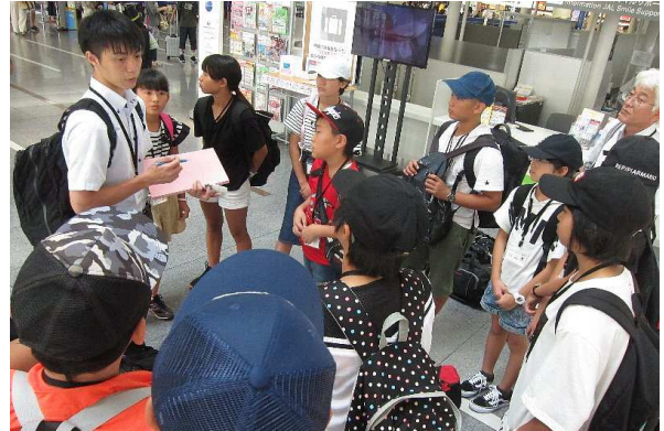
飛行機への搭乗前