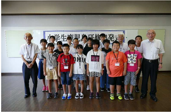
出発式で記念撮影