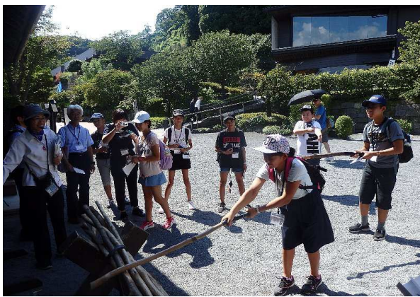
仙巖園・尚古集成館の見学