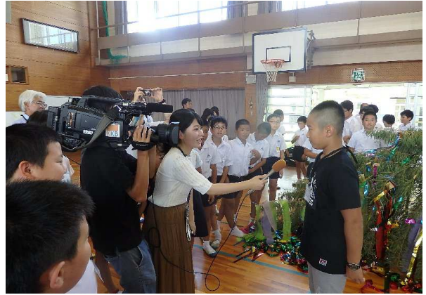
鹿児島テレビ局のインタビュー