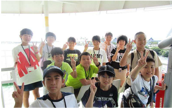
桜島に向かうフェリーにて