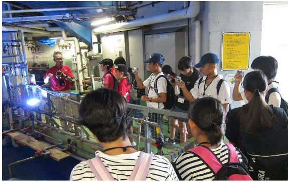
鹿児島水族館 バックヤード見学