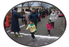
表 彰 1~11部・親子の部の1位から3位にメダルを、 上位8位(一般・40歳は5位)までに賞状を授与します。 ※ ジョギングの部の順位表彰はありません。

申込方法 下記申込書を教育委員会へ提出してください。 町内小中学生は各学校への提出も受け付けます。